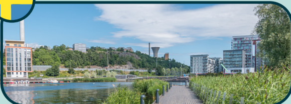
Écoquartier Hammarby Sjöstad près de Stockholm