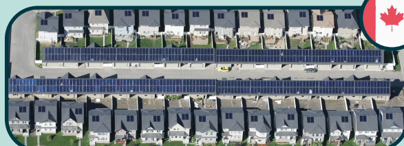
Écoquartier de Drake Landing au Canada