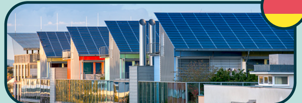
Écoquartier Vauban à Fribourg-en-Brigau